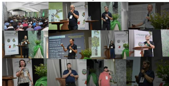
Evento contou com diversas palestras temáticas

Tendo em vista o sucesso e o alcance do evento, a organização do congresso definiu a data para a próxima edição, a ser realizada no mesmo local no ano de 2025, de 25 a 27 de novembro.