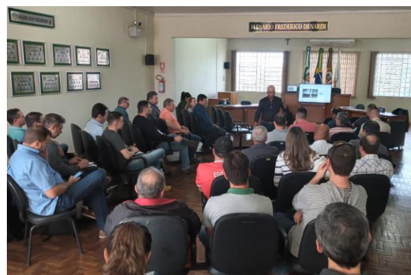
Representantes municipais e produtores rurais, discutiram a consolidação da IG para o Alto vale do Taquari..

Os trabalhos estão sendo conduzidos pelo grupo de gestor da IG, apoiados pelo Sebrae e Emater/Ascar-RS