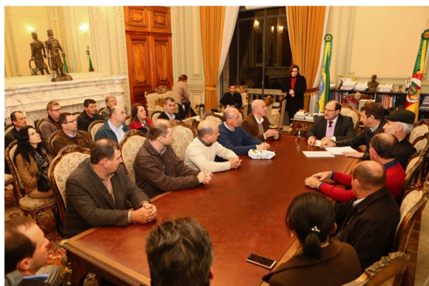
Grupo Apresentou Cadastro ao Governador do estado.

O sistema permitirá a gestão da cadeia produtiva da Erva-mate no Estado do RS em todos os níveis, fornecendo um banco de dados dinâmico e atualizado para subsidiar as ações de políticas públicas voltadas ao Complexo Erva-mate no estado.