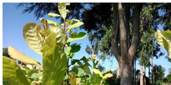
Erval sombreado no espaço da família rural, na EXPODIRETO-COTRIJAL.