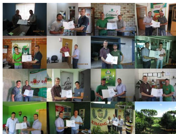
Visitas realizadas no período de 06 a 08 de fevereiro de 2017.