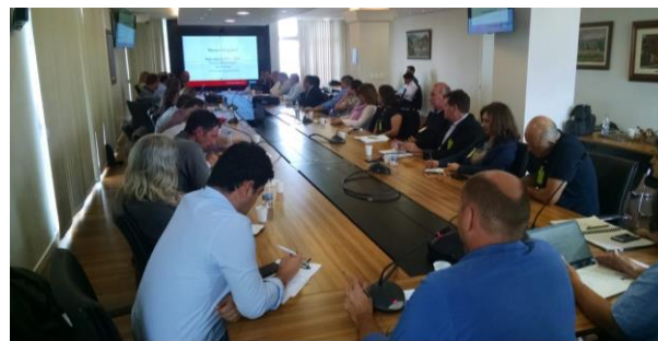
Reunião teve expressiva participação do setor, através de seus representantes e convidados. (Foto: Tiago Fick – SEAPI).