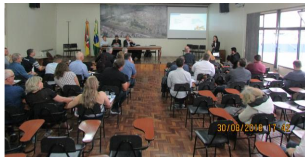
Reunião realizou-se durante Expointer 2018 - Esteio/RS.

O Ministro também apontou que de 2015 para cá, o Mercosul conseguiu solucionar 67 de 78 entraves comerciais, os 11 restantes ainda estão sendo discutidos e negociados, mas, de qualquer forma, já foi um avanço significativo. Destacou que o Brasil continua exercendo uma liderança regional, mas também tem a responsabilidade de combater as assimetrias entre os países membros do Mercosul, até para fortalecer o bloco econômico. Reduzir impostos e melhorar a infraestrutura e logística são algumas medidas para enfrentar a competitividade dos países vizinhos. Ao final o Embaixador se colocou à disposição para tratar de assuntos relacionados à cadeia da erva-mate.