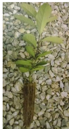
Muda de Erva-mate ideal.