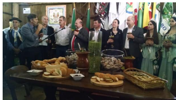
Parlamentares e lideranças do setor privado, homenagearam a bebida símbolo do Estado.

A data foi estabelecida pela Lei 11.929 de 20 de junho de 2003.