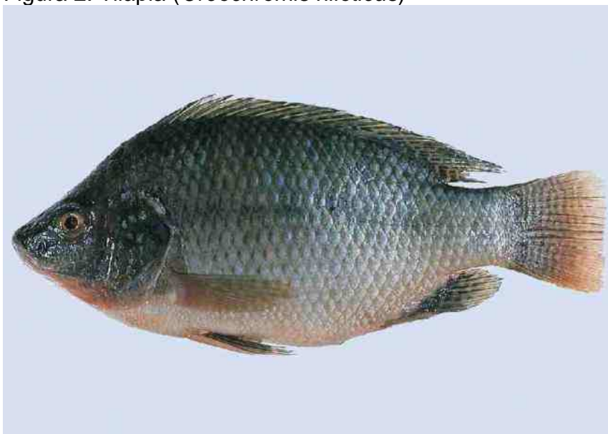
Figura 2: Tilápia ( Oreochromis niloticus )

Com relação às espécies nativas, estas ainda apresentam uma pequena produção quando comparadas com as espécies exóticas, mas algumas como o tambaqui ( Colossoma macropomum ), o pirarucu ( Arapaima gigas ) o dourado ( Salminus brasiliensis ) ou o jundiá ( Rhamdia quelen ), entre outras, estão sendo alvo de estudos e, com isso, seu potencial produtivo está sendo avaliado. O jundiá, por exemplo, peixe nativo da região sul do Brasil vem despontando como uma das espécies mais promissoras para a piscicultura da região. Isso se deve ao seu rápido crescimento, boa resistência a baixas temperaturas e por apresentar um filé de ótima qualidade cujo rendimento de 50% é superior ao rendimento do filé da tilápia. Hoje a espécie conta com uma rede de informações envolvendo diversas instituições dos estados da região sul, a “Rede Jundiá”, que tem o objetivo de melhorar a difusão de informações científicas dos temas envolvendo a espécie.